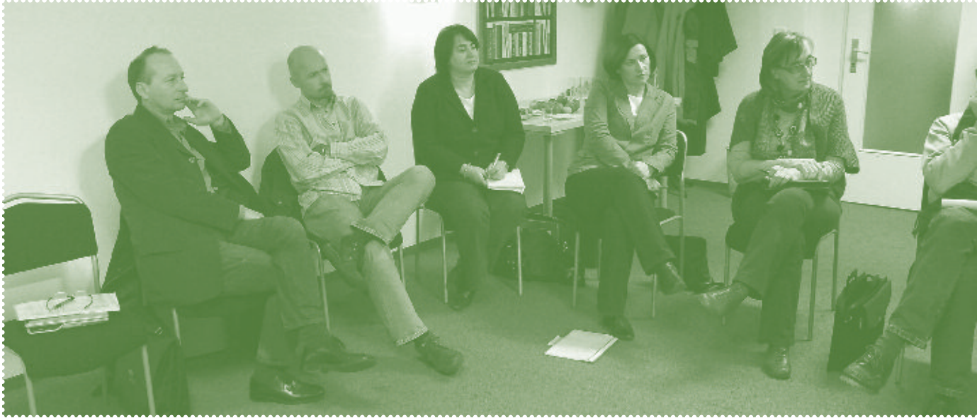
Arbeitsgruppe Pauschalierung Februar, Graz