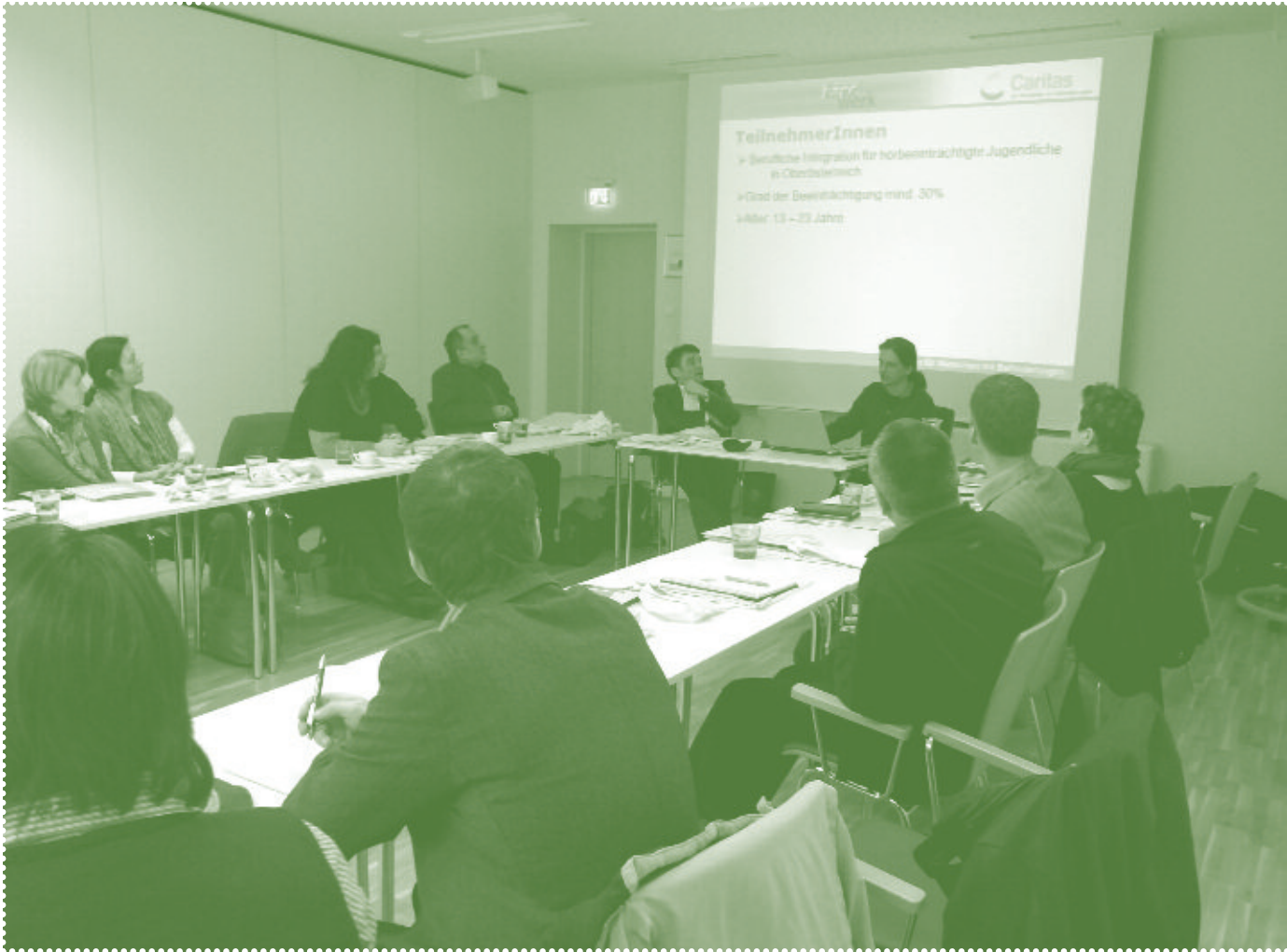
Mitgliederversammlung März, Salzburg