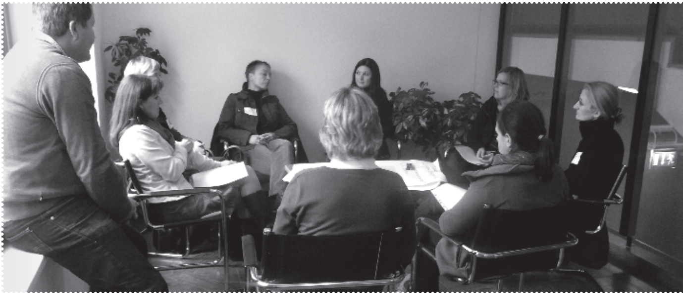
Open Space US und IFD Oktober, Wien