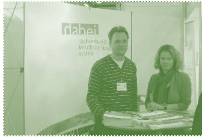
Messestand Personal Austria November, Wien