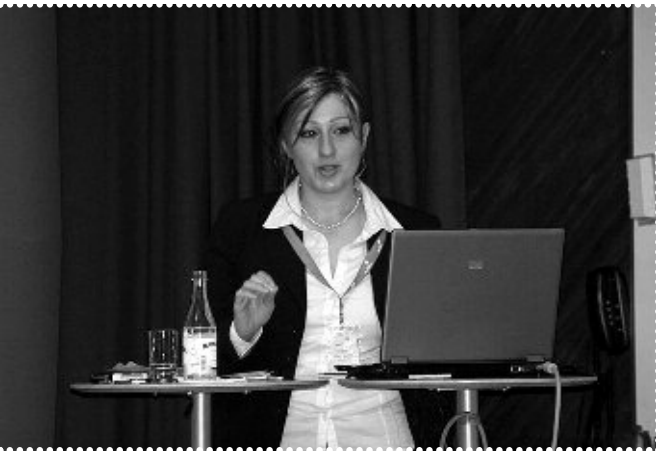
Rikskonferens Schweden November, Örebro