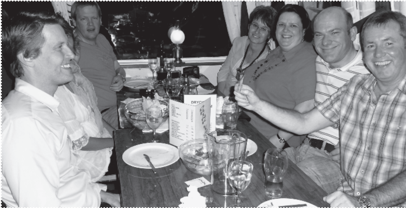
Projektmeeting Leonardo EUSE August, Stockholm

chend beleuchtet sowie Strukturen, Angebote, Finanzierungssituation und Ergebnisse erforscht. Im vergangenen Jahr wurden die Erhebungsinstrumente entwickelt und die Befragung, die bereits im Frühjahr 2010 durchgeführt werden soll, vorbereitet.